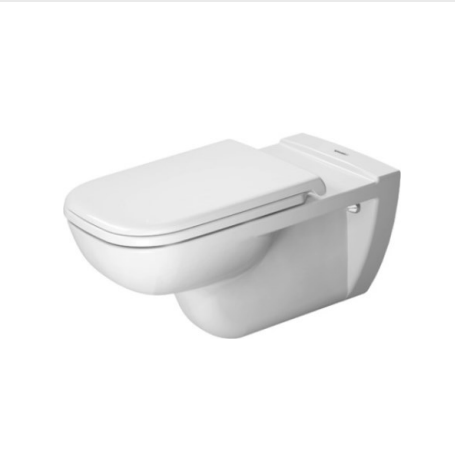
ZÁVĚSNÉ WC 360X700X345MM, BEZBARIÉROVÉ, HLUBOKÉ SPLACHOVÁNÍ, BÍLÁ