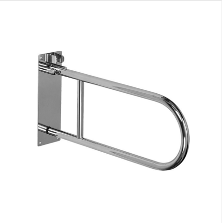
MADLO 830MM, SKLOPNÉ, NEREZ LESK