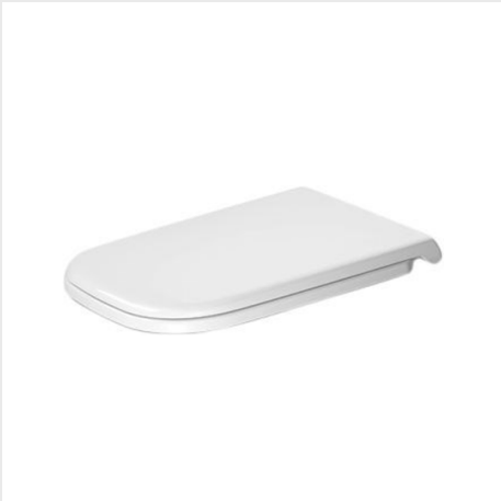
WC SEDÁTKO 361X485MM, BEZ SOFT CLOSE, ZÁVĚSY UŠLECHTILÁ OCEL, DUROPLAST, BÍLÁ