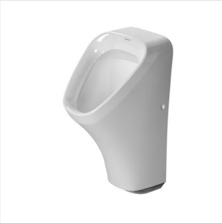
PISOÁR 300X340MM PRO BATERIOVÉ PŘIPOJENÍ, PŘÍTOK ZE ZADU, ODPAD VODOROVNÝ, BÍLÁ