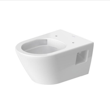
ZÁVĚSNÉ WC 370X540MM, HLUBOKÉ SPLACHOVÁNÍ, ODPAD VODOROVNÝ, BÍLÁ