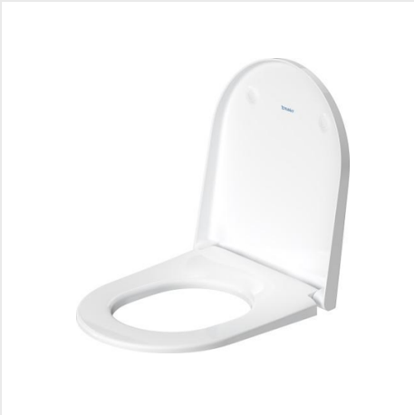
WC SEDÁTKO 376X441MM, BEZ SKLÁPĚCÍ AUTOMATIKY, ZÁVĚSY UŠLECHTILÁ OCEL, BÍLÁ